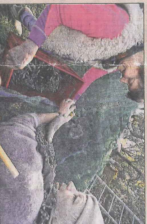
Ces deux bénévoles du Secours catholique aiment partager de leur temps avec les personnes dans le besoin.

Le concours d'architecture vient tout juste d'être lancé pour une